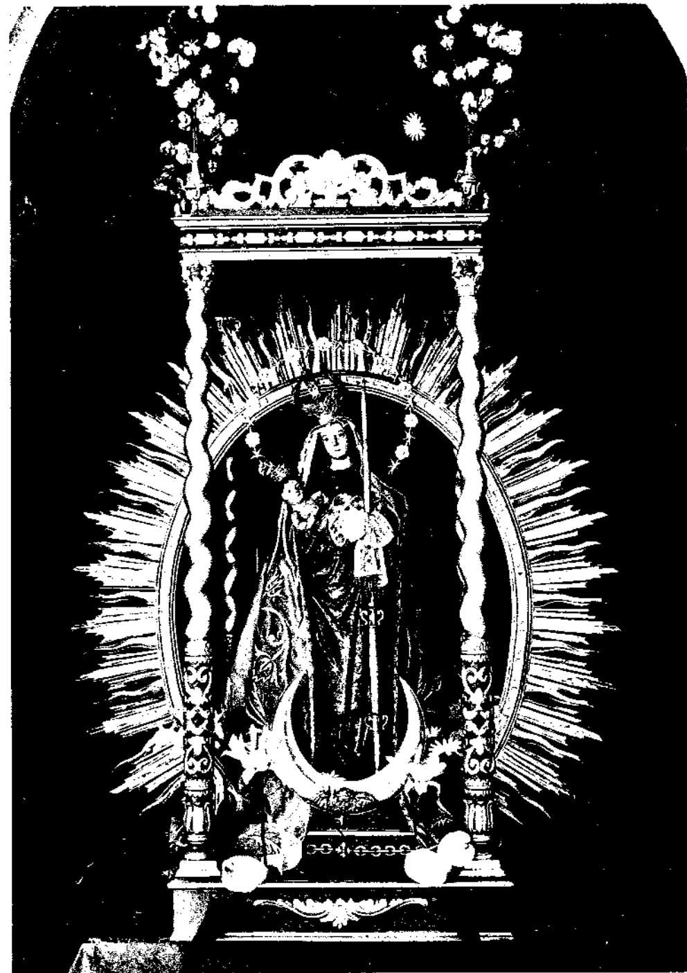
Nuestra Señora de Candelaria