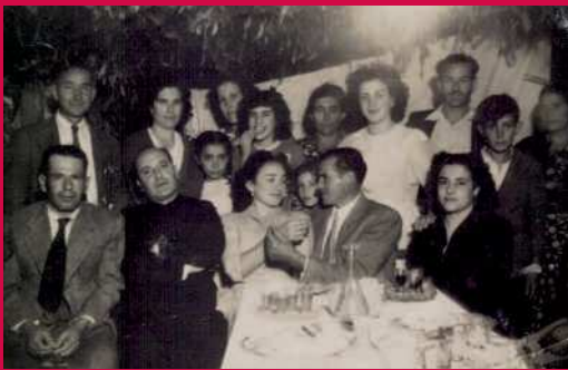
De celebración familiar