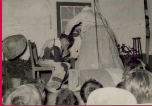
Obra de teatro