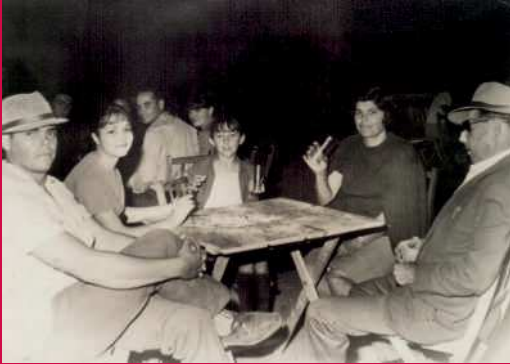
Familia disfrutando de las fiestas patronales