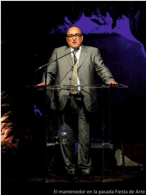
El mantenedor en la pasada Fiesta de Arte