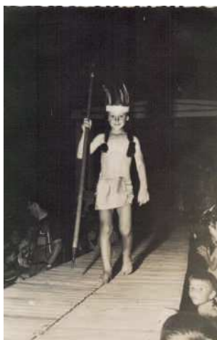
Niño vestido de indio en el desfile infantil