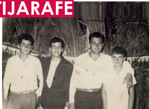
Jóvenes en la fiesta de La Punta