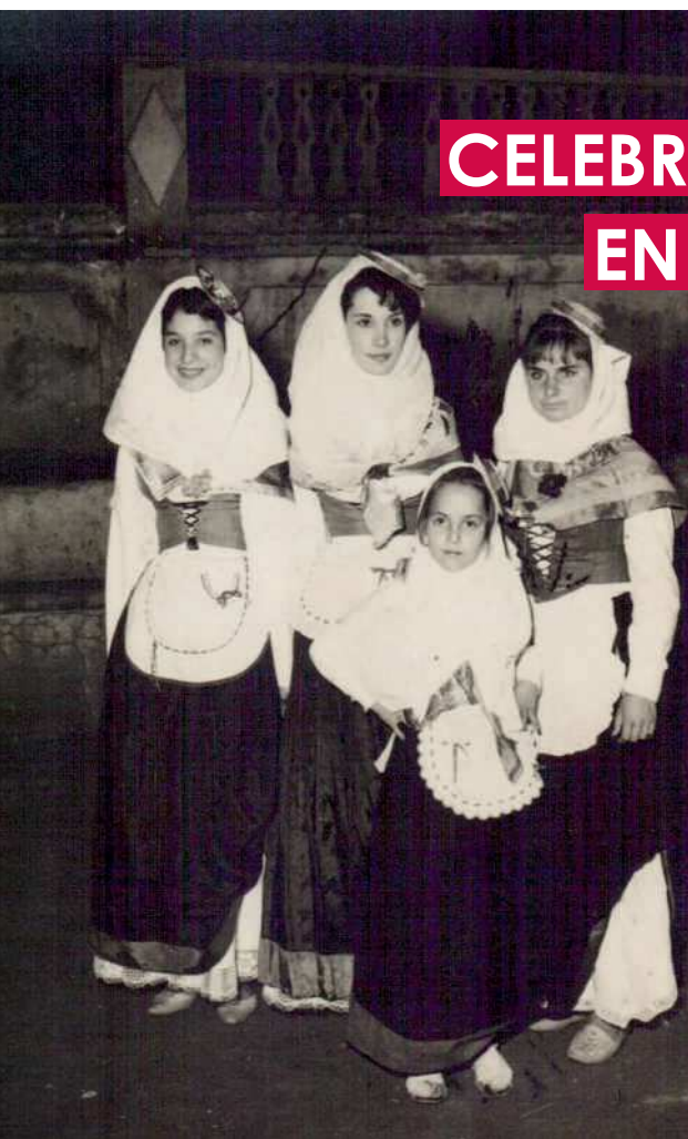
Baile de los pastores