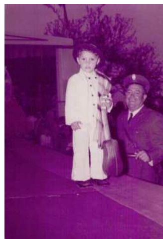
Participando en un desfile infantil