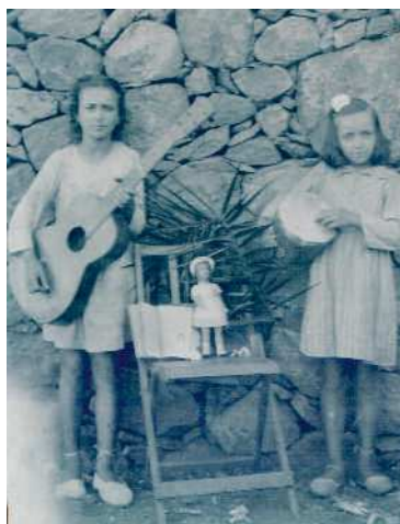
Niñas con instrumentos