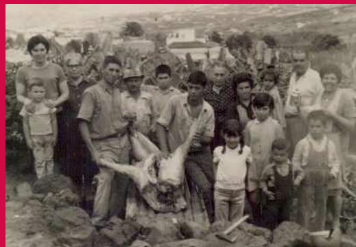
Familia reunida en una matanza de cochinos